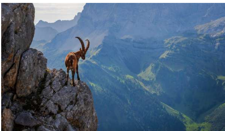
Wie viel ärmer wären die Alpen ohne den Steinbock! Beinahe wäre er ausgerottet worden. Muss er ein Held des Klimas, der Biodiversität oder der Gesellschaft sein, um ein Existenzrecht zu haben, oder darf er auch bleiben, wenn er nichts nützt?

Den jährlich über 700'000 Besuchern des Serengeti-Nationalparks in Tansania dürfte es vollkommen gleichgültig sein, was so ein Löwe eigentlich nützt und ob die Gnus nun eher günstig oder ungünstig auf die lokale Biodiversität wirken. Das Erleben der Tiere ist so toll, dass es die teure und lange Reise auf jeden Fall lohnt. Die Reisebranche weiss das und sie würde daher nie auf die Idee kommen, Reisen zu den «big five» mit dem ökologischen oder wirtschaftlichen Nutzen dieser Tiere anzupreisen. Sie verkauft