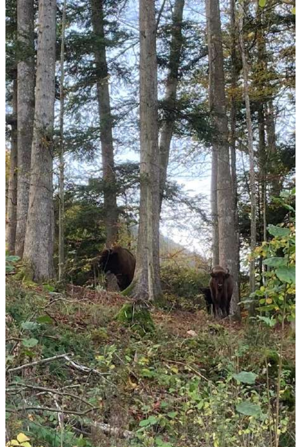
Riesige Bäume und riesige Tiere: nach mehr als 1000 Jahren sind solche Begegnungen wieder möglich. Was für ein Gewinn für den Jurawald und welche Freude für den Jurawanderer!

Als der Steinbock vor gut hundert Jahren illegal in die Schweiz zurückgebracht wurde, half das Eidgenössische Departement des Innern bei der Finanzierung und wies die Grenzschutz an, den Steinbockschmuggel aus Italien zu dulden; einen Nutzen für Klima, Biodiversität und Gesellschaft musste man damals noch nicht als Grund dafür nennen. Ich frage mich manchmal, ob man heute noch Steinböcke wiedereingebürgern könnte, da sie doch auf den Alpweiden mitfressen, lokal junge Bäume zerbeissen und manchmal enge, exponierte Bergwege blockieren, so dass der Wanderer nicht vorbeikann. Sind Steinböcke klimafreundlich? Ich weiss es nicht und es ist mir auch nicht so wichtig.