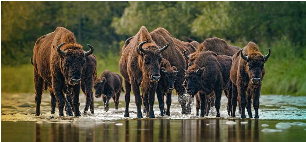
Wisente in der Slowakei. Müssen sie nützlich sein, oder sind sie auch «einfach so» grossartig?

Das Projekt Wisent Thal untersucht, ob der im Mittelalter ausgerottete Wisent im Jura heute wieder als Wildtier tragbar ist. Dazu wird eine Wisent-Testherde während 5 Jahren im Gehege gehalten. Diese stammt vom Wildnispark Zürich Langenberg, der als Projektpartner auch für die Koordination mit dem Erhaltungszuchtprogramm der EAZA verantwortlich ist. Das eingezäunte Testgelände in Welschenrohr gehört der Bürgergemeinde Solothurn und dem Landwirt und Wisent-Ranger Benjamin Brunner. Es wird weiterhin land- und forstwirtschaftlich genutzt und ist für die Öffentlichkeit zugänglich.