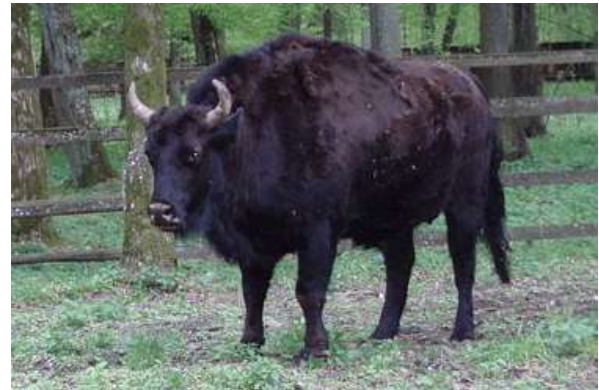
Bilder: Wisent-Hausrind-Mischlinge, genannt «Żubroń», sind im Vergleich zu Wisenten massige Tiere – die Bullen erreichen bis zu 1200 kg und die Kühe bis zu 810 kg – und sie sind meistens hässlich.